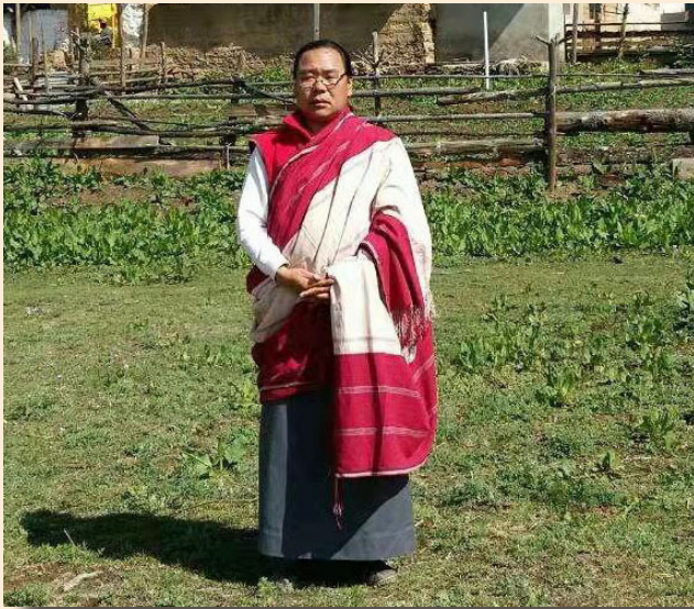
དོ་ཇེ་སློབ་དཔོན་ཚེ་རིང་གྲགས་པ།