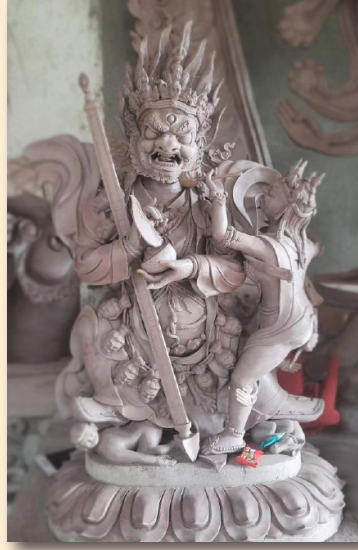
མགོན་པོ་ལེགས་ལྷན་ཚོགས་ཀྱི་བདག་པོ།