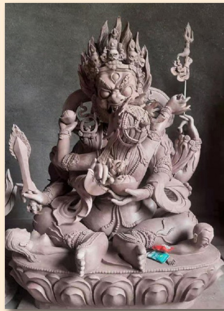
མགོན་པོ་ཕྱག་བཞི་པ།