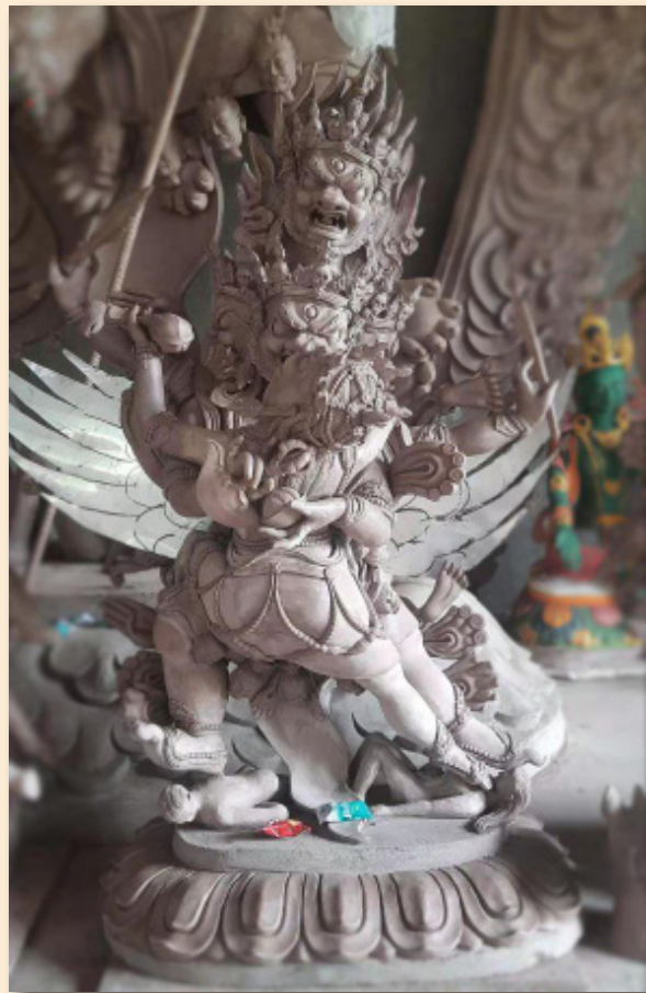
མགོན་པོ་ཞལ་བཞི་པ།