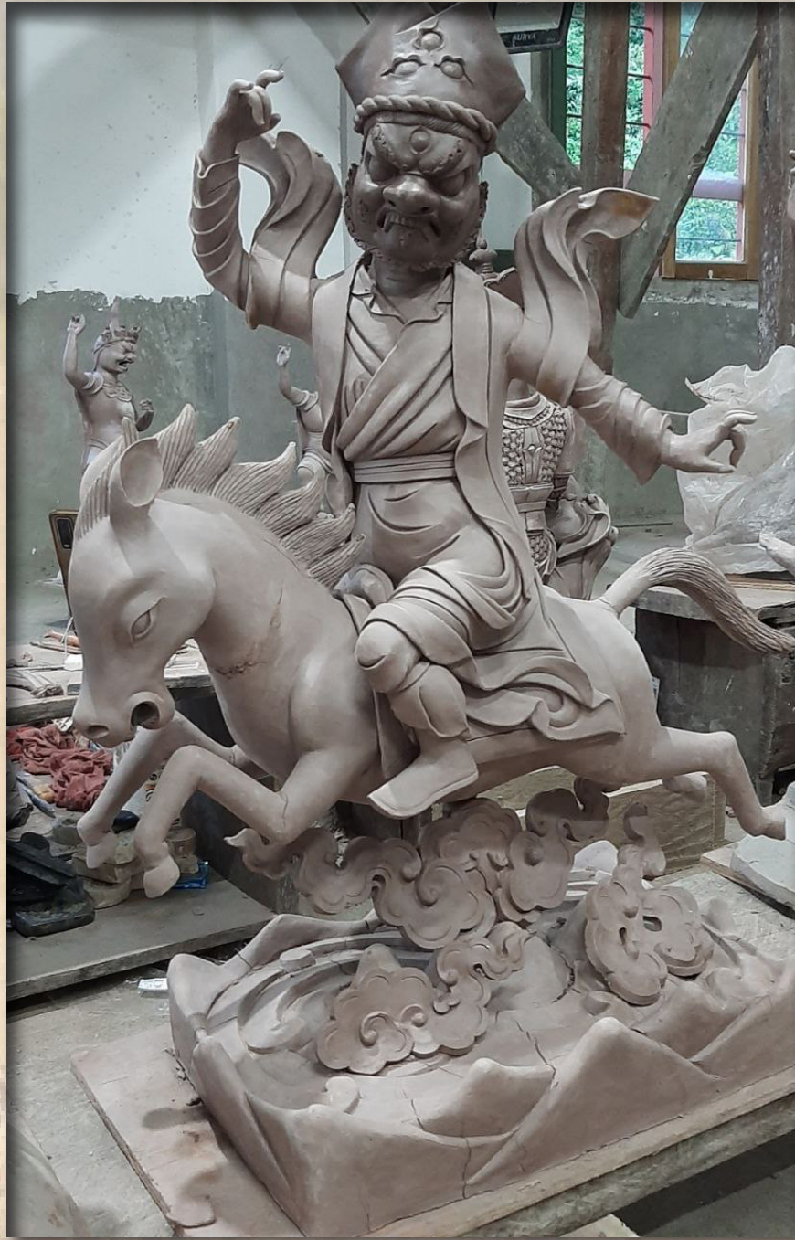
ལཱུ་རི་ལུང་པའི་སྐྱེས་བཙམ་རྟེན་པ་དབང་སྐུད་ལ་ན་མོ།