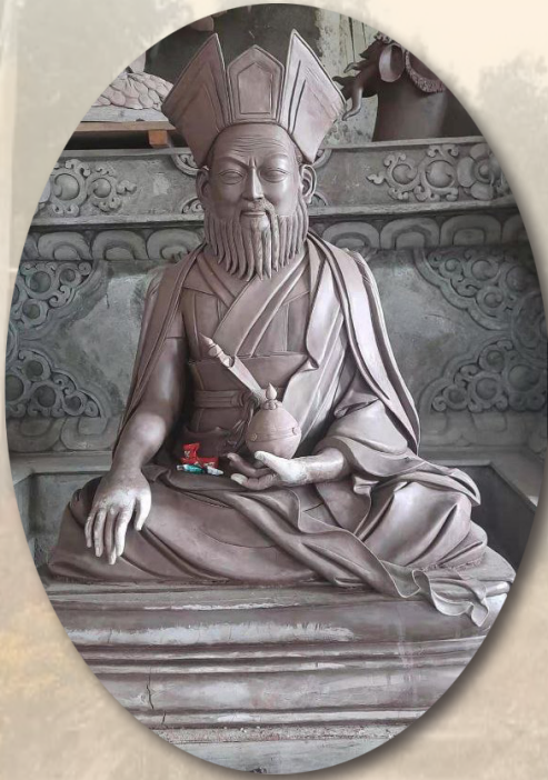
རིག་འཛིན་གཏེར་བདག་གླིང་པ།