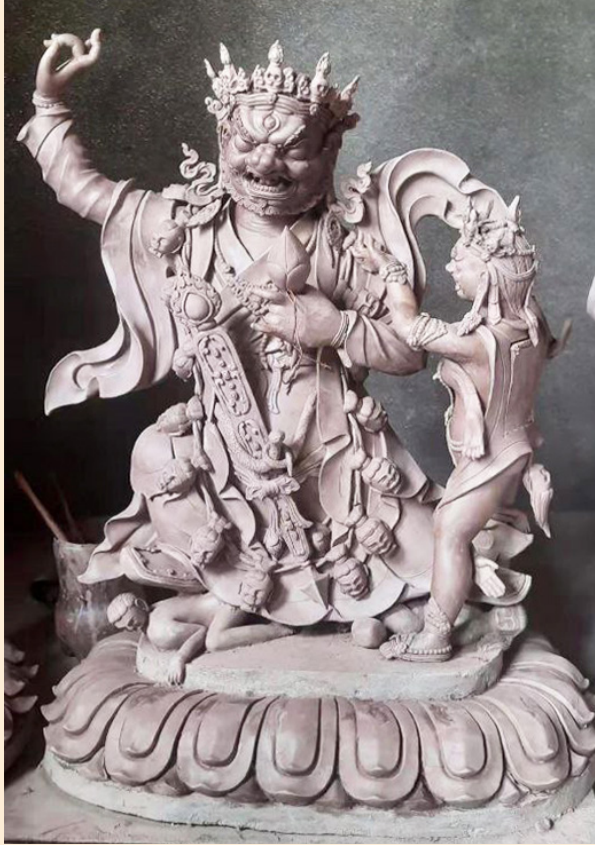
དཔལ་མགོན་མ་ཉིང་ནག་པོ།