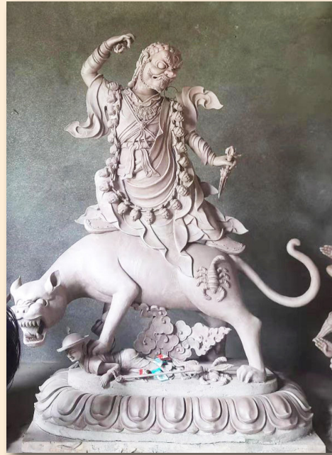
རྟོ་རྩེ་གྲོ་བོ་ལོང།