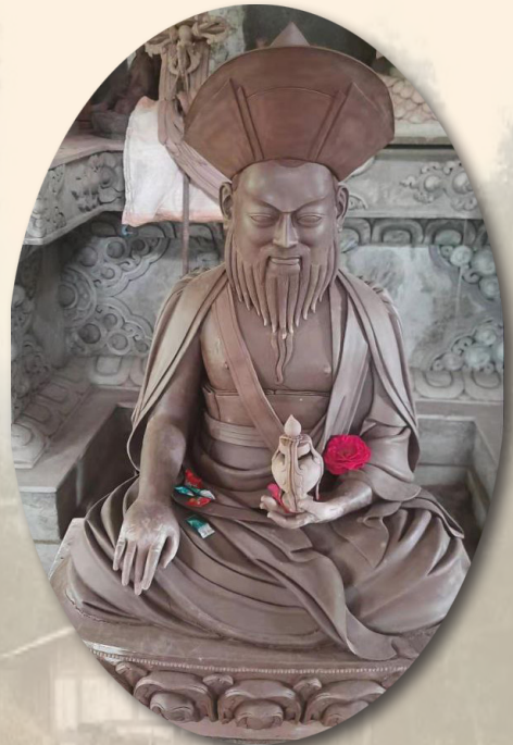
ཞབས་རྗེ་དག་དབང་རྣམ་གྲུལ།