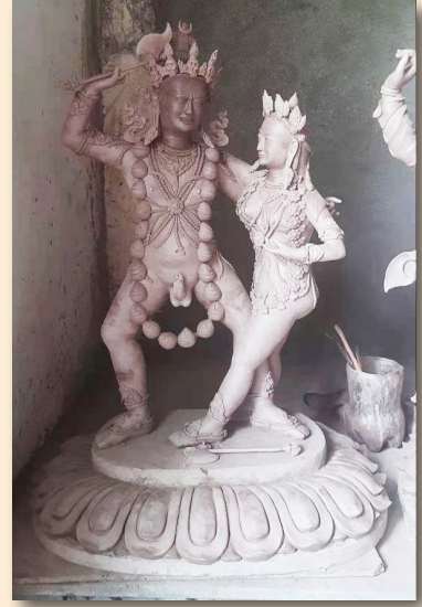
ལྷ་ཚེན་དབང་ལྷུག་ཚེན་པོ།