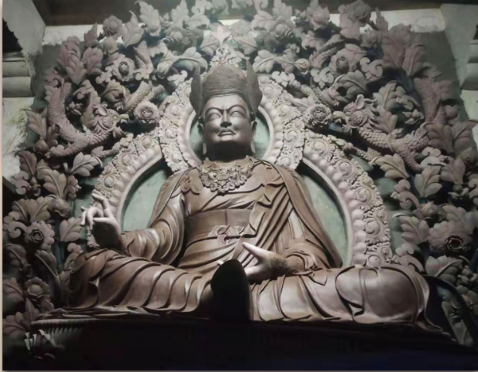
གུ་རུ་སྤྱང་སྲིད་ཟིལ་གཞོན། Guru Nang-Sid Zilnoen