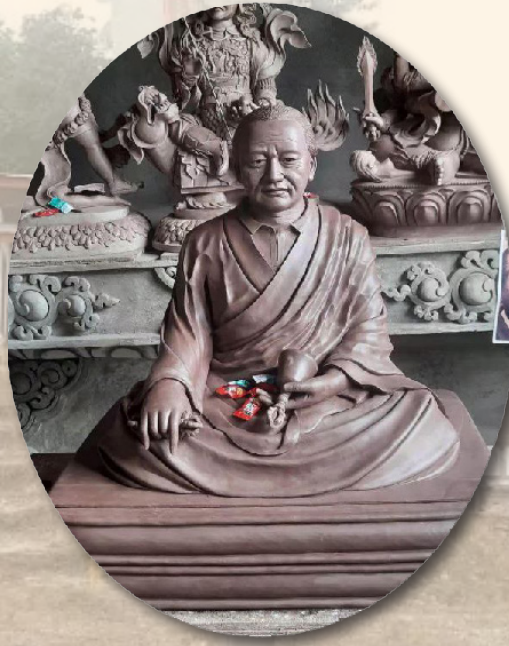
ཡུལ་བས་རྗེ་བདུན་འཛོམས་འཇིགས་བྲལ་ཡེ་ཤེས་རྗེ་རིན་པོ་ཆེའི་སྐུ་འདྲ།