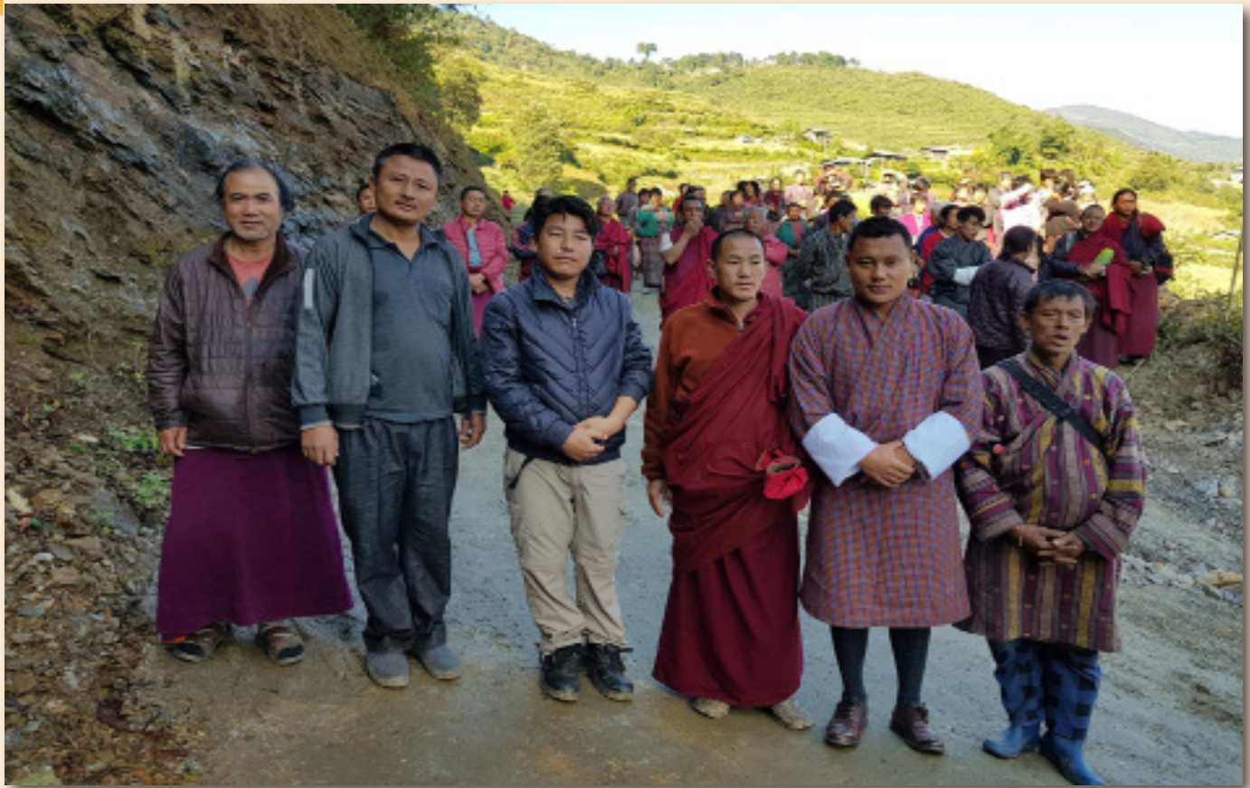
དགོན་པ་དུ་ལམ་སེལ་བ། Clearing road towards Gonpa