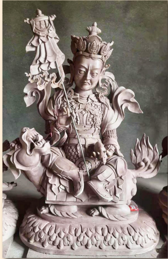
རྣམ་ཐོས་སྲས།