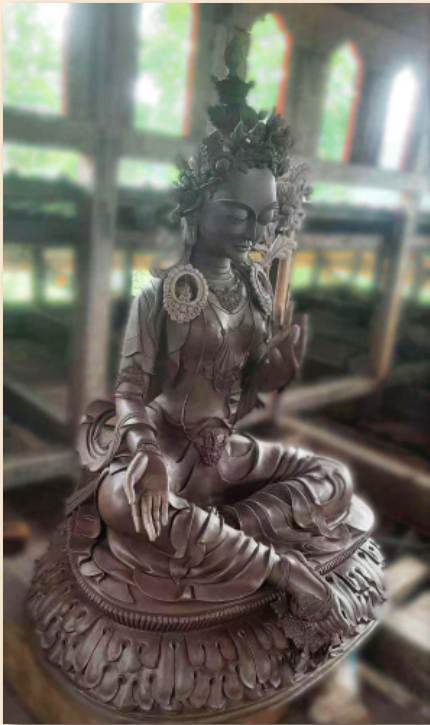
འཕགས་མ་རྒྱལ་མ།