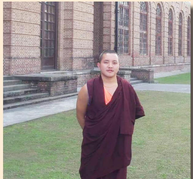
སློབ་དཔོན་སེངྒེ་དབང་ལྷུག། (Lt. Meme Trulku's son)