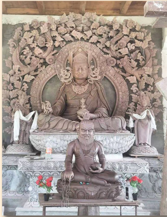
གྲུབ་ཐོབ་ཐང་སྟོང་རྒྱལ་པོ།