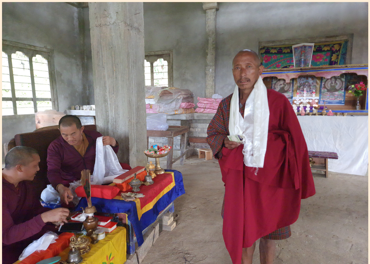
ཐབ་ཚང་པ་དང་འཆམ་དཔོན་མཛད་པའི་བགྲིས་པའི་དར་སྤུལ་བ།