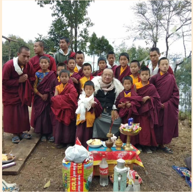
འཕགས་མཚོག་ལྷ་མ་རིན་པོ་ཆེ་དགོན་པར་དུ་སྲོན་ནས་དགོ་སློང་དང་མཚམས་པ་རྣམས་ལ་མཇལ་སྟངས་གནང་བ། Ad-hoc visit of H.H. Phagchok Lama Rinpoche