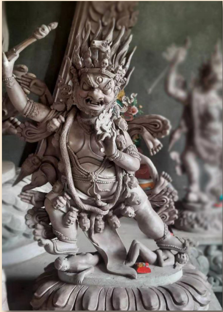
རྟ་མགིན།