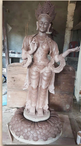
མཁའ་འགྲོ་མུ་ར་བ།