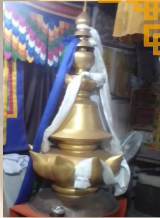
ངང་ལམ་དང་སྤྱིན་རྒྱལ་ས་གྲིས་གསེར་ཏོག་གི་སྤྱིན་བདག་མཚོ་པ། Devotees from Nganglam offered Sertog