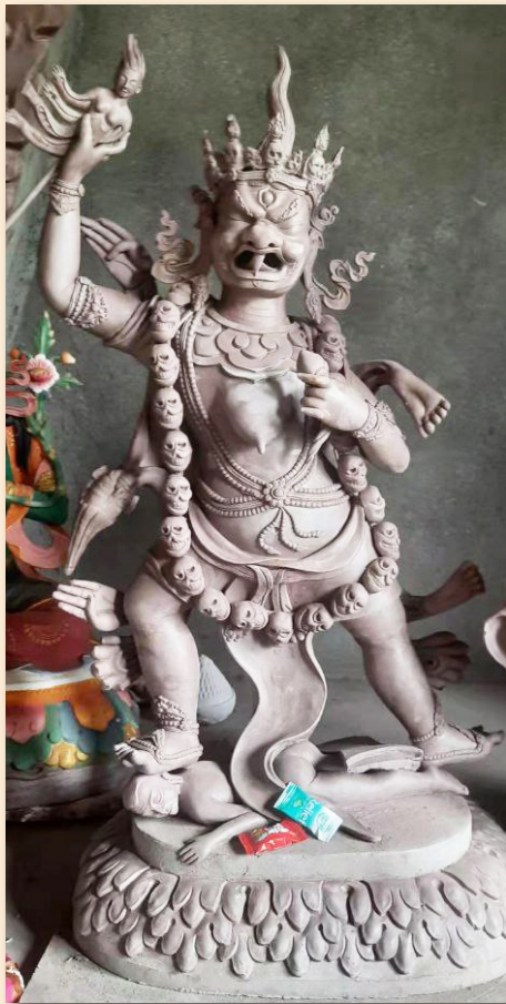
མ་མོ་སྲུགས་ཀྱི་སྲུང་མ།