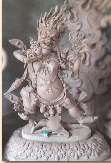
ཞིང་སྲོང་དུར་ཁྲི་མ་མོ།