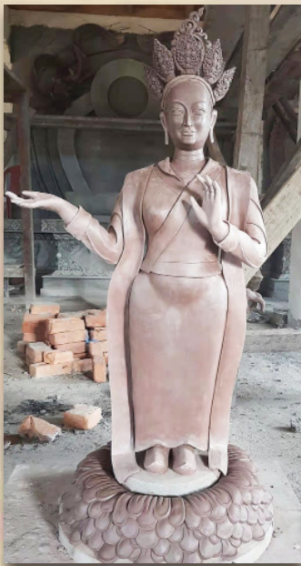
མཁའ་འགྲོ་ཡེ་ཤེས་མཚོ་རྒྱལ།