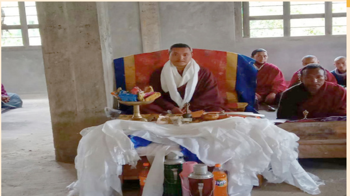
སློབ་དཔོན་དགོན་པ་དུ་ཐེབས་པའི་བགྲིས་པའི་དར་སྤུལ་བ།